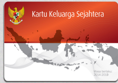
1. Kartu Keluarga Sejahtera (KKS)

Bagi keluarga kurang mampu penerima Kartu Perlindungan Sosial (KPS), tukarkan KPS di kantor pos yang telah ditentukan dengan: