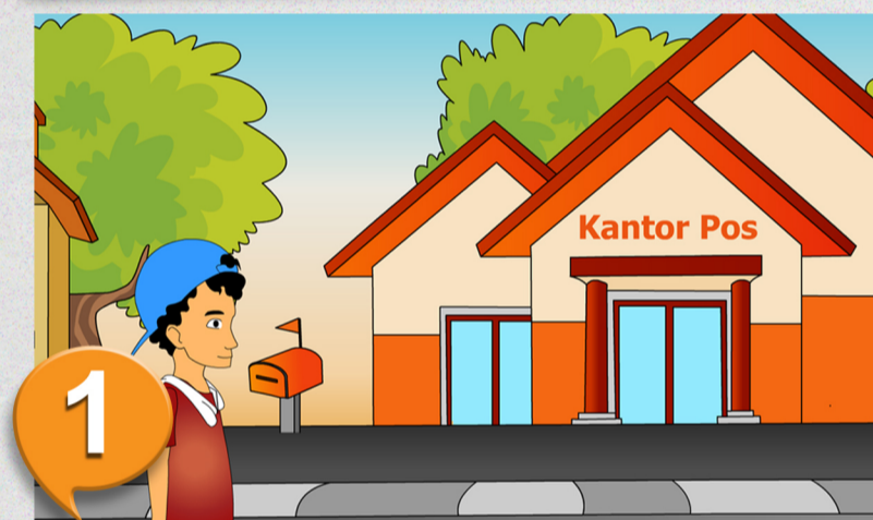
1. Datang ke kantor pos dengan membawa KPS. Apabila KPS hilang, sertakan identitas lain dan surat keterangan kepala desa/lurah.