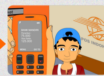
Saldo simpanan akan diketahui melalui SMS. Tunjukkan SMS dan kemasan kartu HP untuk menarik uang dari simpanan.