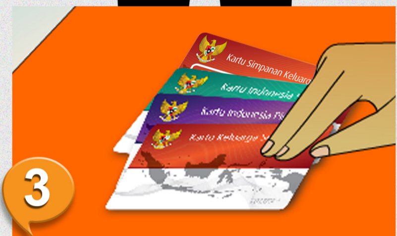
3. Petugas akan memberikan KKS, SIM card (kartu HP) yang berisi uang elektronik, KIP, dan KIS, serta tanda bukti serah terima untuk ditandatangani.

Rumah Tangga yang belum mendapatkan KKS, SIM Card, KIP, & KIS, KPS masih tetap berlaku