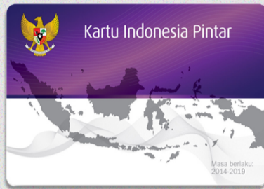
3. Kartu Indonesia Pintar (KIP)