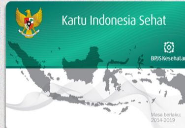
4. Kartu Indonesia Sehat (KIS)