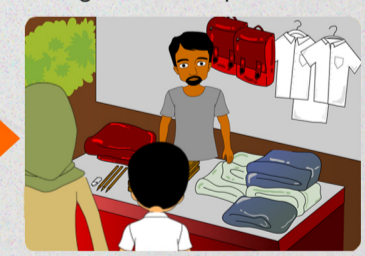
Manfaatkan BSM untuk keperluan pendukung sekolah (seragam, buku, transport, dan lain-lain).