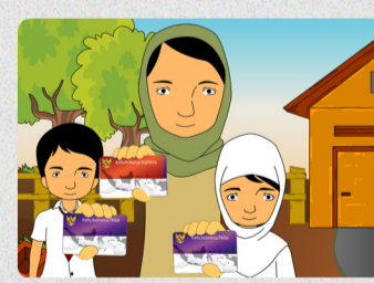
Bawa KIP, KKS, dan Kartu Keluarga (atau identitas lain) ke sekolah terdaftar.