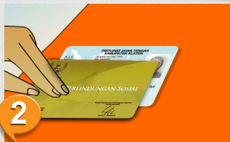
2. Serahkan KPS dan identitas lain kepada petugas pos dan tunggu proses pengecekan. Jika KPS hilang akan dilakukan proses pemeriksaan tambahan oleh dinas sosial atau aparat/petugas pemda yang ditunjuk.