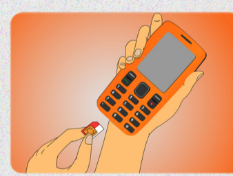
Masukkan kartu HP ke dalam HP dan simpan kemasan kartu HP.