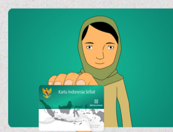
KIS digunakan untuk dapatkan layanan kesehatan.